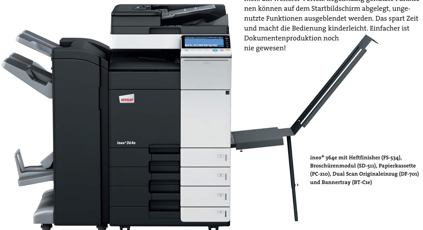
ineo+ 364e mit Heftfinisher (FS-534), Broschürenmodul (SD-511), Papierkassette (PC-210), Dual Scan Originaleinzug (DF-701) und Bannertray (BT-C1e)

Viele Multifunktionssysteme sind alles andere als anwenderfreundlich. Doch damit ist nun Schluss – die ineo+ 364e ist für Ihre Anforderungen wie geschaffen. Das Bedienungskonzept ist intuitiv erfassbar und genauso leicht verständlich wie das eines Smartphones oder Tablet-PCs. Der kapazitive 9 Zoll-Touchscreen verfügt über vertraute Funktionen wie flick, drag&drop und pinch in&out, sodass die Bedienbarkeit ganz einfach ist. Und dank der neuen Menüstruktur lassen sich alle Funktionen auf einen Blick erfassen und die gewünschten Einstellungen mit nur wenigen Berührungen vornehmen. Ein weiterer Vorteil: Regelmäßig genutzte Funktionen können auf dem Startbildschirm abgelegt, ungenutzte Funktionen ausgeblendet werden. Das spart Zeit und macht die Bedienung kinderleicht. Einfacher ist Dokumentenproduktion noch nie gewesen!