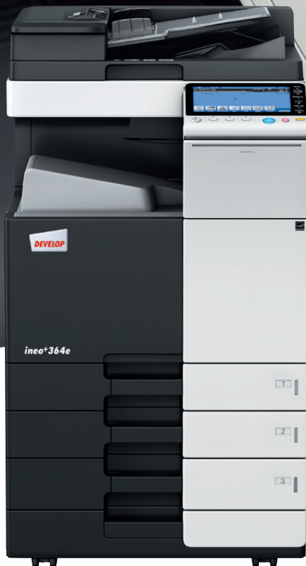
ineo+ 364e mit Papierkassette (PC-210) und Dual Scan Originaleinzug (DF-701),