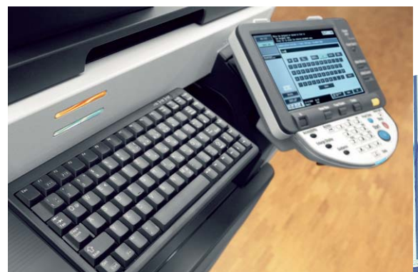
ineo 283 farbiges Touchscreen Display und optionale Tastatur für einfache Eingabe

Profitieren Sie von einem perfekten Team und nutzen Sie die ineo 283 für die Dokumentenproduktion in Schwarzweiß kombiniert mit den ineo+ Systemen für die Erstellung professioneller Farbdokumente.