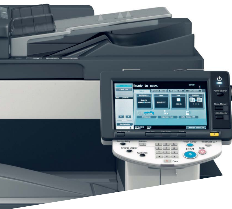
Das leicht bedienbare Farbdisplay der ineo 283

Die hohe Druckqualität in Verbindung mit einer großen Auswahl an Finishing-Funktionen ermöglichen es, selbst höherwertige Dokumente wie Broschüren inhouse zu drucken, zu lochen oder zu heften. Das steigert die Produktivität nachhaltig!