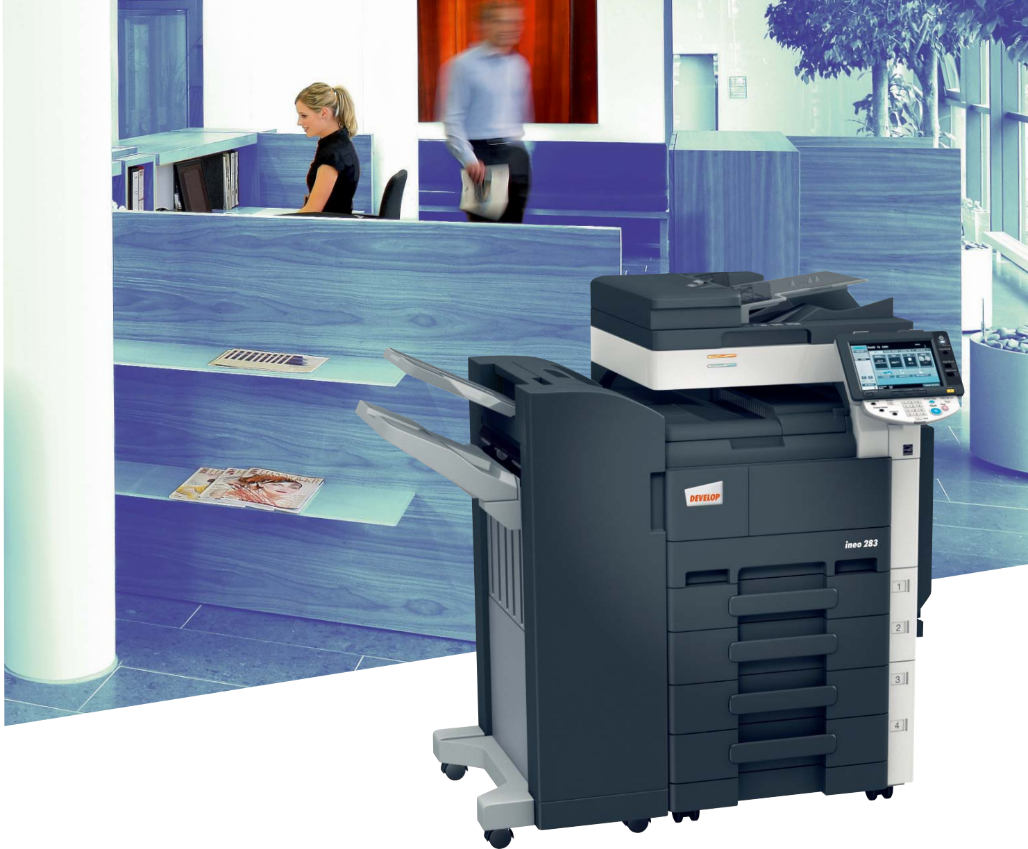
ineo 283 mit Standfinisher (FS-527), Papierkassette (PC-208) und Originaleinzug (DF-621)