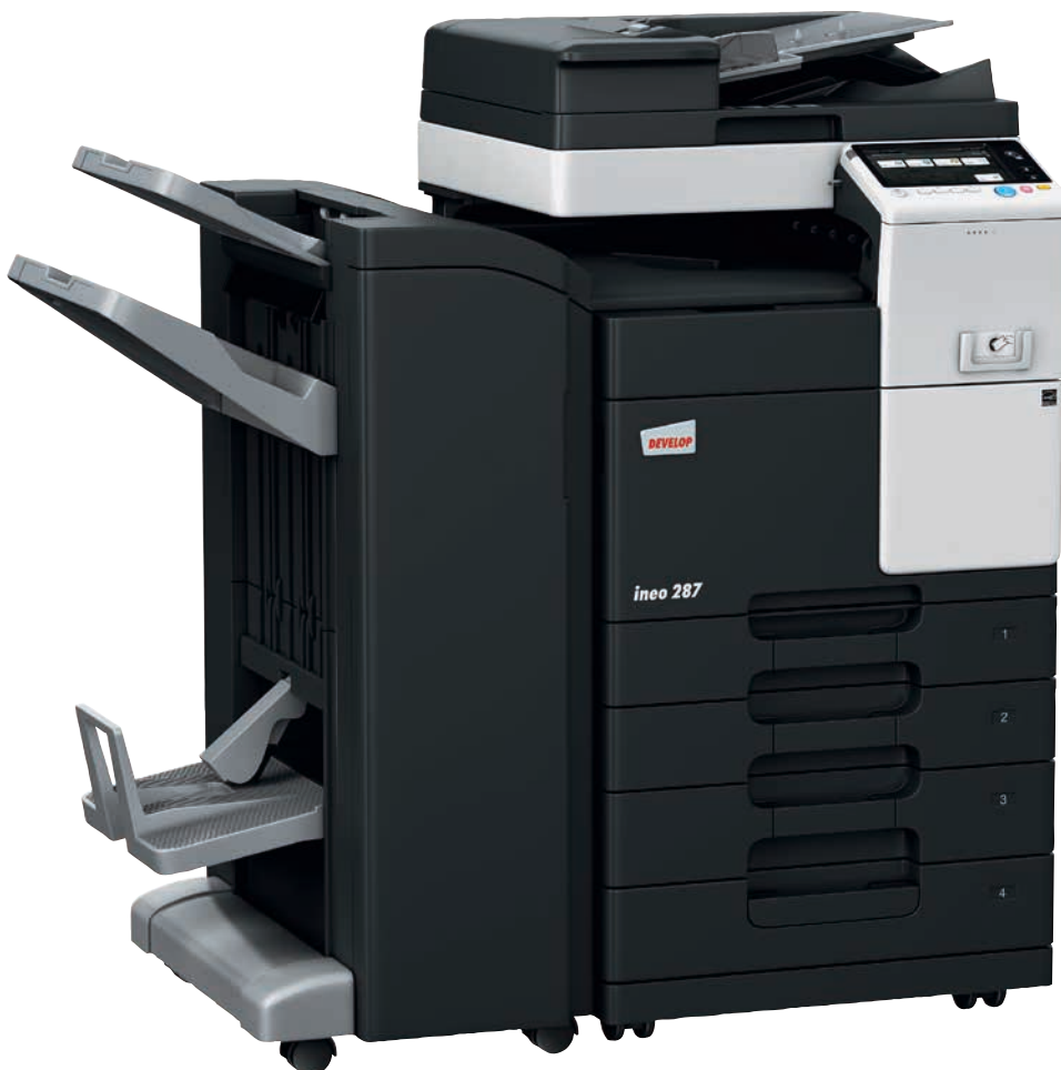
ineo 287 mit Duplex-Origineleinzug (DF-628), Heft-/Broschüren-Finisher (FS-534SD), Papiereinzug (PC-213) und Montage-Kit für lokales ID-Kartenauthentifizierungsgerät (MK-735)

Die Schwarzweißsysteme zeichnen sich durch eine Vielzahl von Energiesparfunktionen aus, die den Energieverbrauch senken. Diese Funktionen sparen nicht nur Geld, sondern sind auch gut für die Umwelt – und Ihre CO 2 -Bilanz.