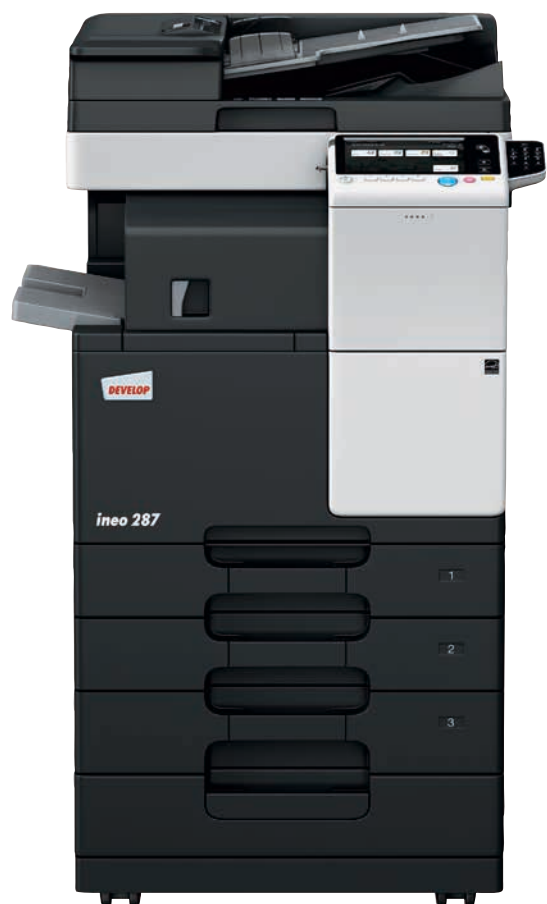
ineo 287 mit Duplex-Origineleinzug (DF-628), Zweifachablage (FS-533), Papiereinzug (PC-113) und 10er-Tastatur (KP-101)