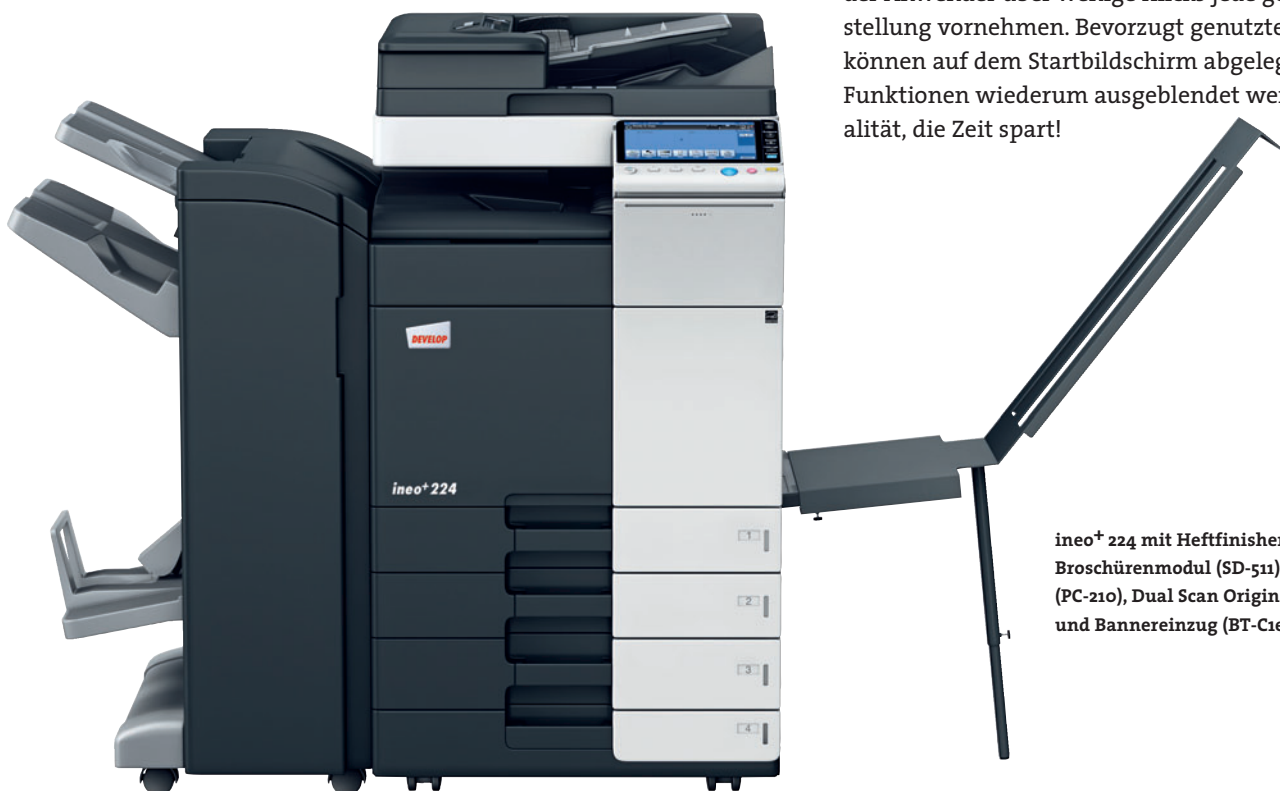
ineo+ 224 mit Heftfinisher (FS-534), Broschürenmodul (SD-511), Papierkassette (PC-210), Dual Scan Originaleinzug (DF-701) und Bannereinzug (BT-C1e)

Verirrt im Funktionendschungel gängiger Multifunktionssysteme? Diese Problematik legt die ineo+ 224 ad acta. Dank ihres intuitiven und eingängigen Bedienungskonzepts ist das System genauso einfach zu handhaben wie das eigene Smartphone oder der Tablet-PC. Der kapazitive 9 Zoll-Touchscreen verfügt über vertraute Funktionen wie „flick&drag“ (wischen und ziehen). Und die neue Menüstruktur präsentiert einen komfortablen Überblick über alle Funktionen. So kann der Anwender über wenige Klicks jede gewünschte Einstellung vornehmen. Bevorzugt genutzte Funktionen können auf dem Startbildschirm abgelegt, ungenutzte Funktionen wiederum ausgeblendet werden. Individualität, die Zeit spart!