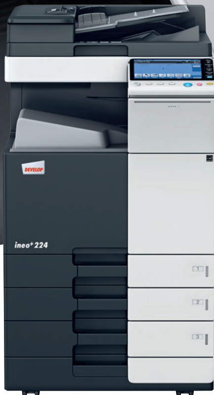
ineo+ 224 mit Papierkassette (PC-110) und Dual Scan Originaleinzug (DF-701)