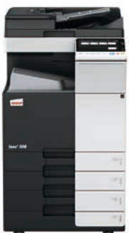
ineo+ 308 mit Dual Scan Original-einzug (DF-704), Ausgabefach (OT-506) und Papiereinzug (PC-210)

Wenn Sie in eine ineo+ 308 investieren, sind Sie in Bezug auf Spezialaufgaben, wie z. B. auf hochwertigem Karton gedruckte Einladungen, nicht mehr von externen Dienstleistern abhängig. Dadurch sparen Sie Zeit und Geld. Mit der ineo+ 308 können Umschläge, Recyclingpapier, vorbedrucktes Papier, OHP-Folien, viele andere Medien und selbst Karton bis zu einem Papiergewicht von 300 g/m 2 bearbeitet werden. Diese Systeme können zahlreiche Papierformate, von A6 bis A3+ (SRA3), sowie benutzerdefinierte Formate und Banner bis zu einer Länge von 1,2 Metern bedrucken. Außerdem ermöglichen die vielfältigen Endbearbeitungsoptionen das Erstellen bis zu 80-seitiger Broschüren, verschiedene Arten des Brieffaltens, das Heften von Handouts oder Lochen von Rechnungen. Mit einer ineo+ 308 kann fast jeder Druckauftrag intern bearbeitet werden.