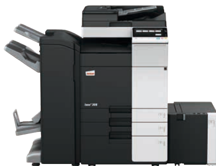
ineo+ 308 mit Dual Scan Original-einzug (DF-704), Heftfinisher mit Broschüreeneinheit (FS-534SD), Großraumfach (LU-302) und Papiereinzug (PC-410)