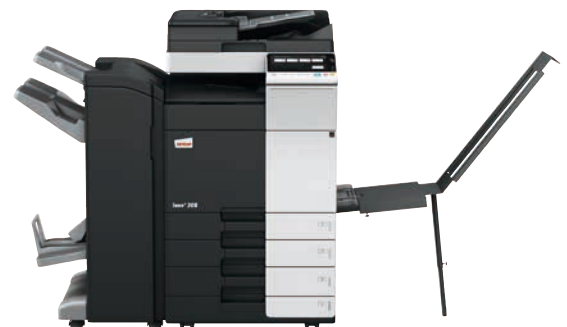
ineo+ 308 mit Dual Scan Original-einzug (DF-704), Heftfinisher mit Broschüreeneinheit (FS-534SD), Bannereinzug (BT-C1e) und Papiereinzug (PC-210)